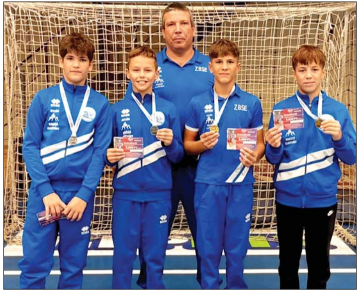
A döntőket szeptember 27-én Tatabányán rendezik meg.