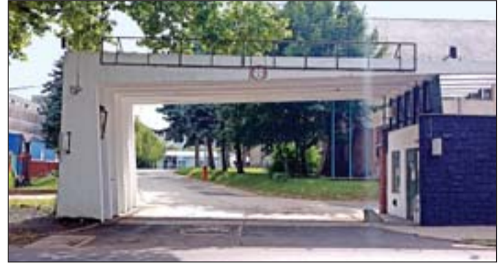
Az egykori kapubejárat.

A cég képviselője érdeklődésünkre ezzel kapcsolatban azt válaszolta, hogy valóban az volt a szándékuk, hogy megtartsák a kaput, hiszen annak stílusa és formavilága nekik is tetszett. A volt tejipa-