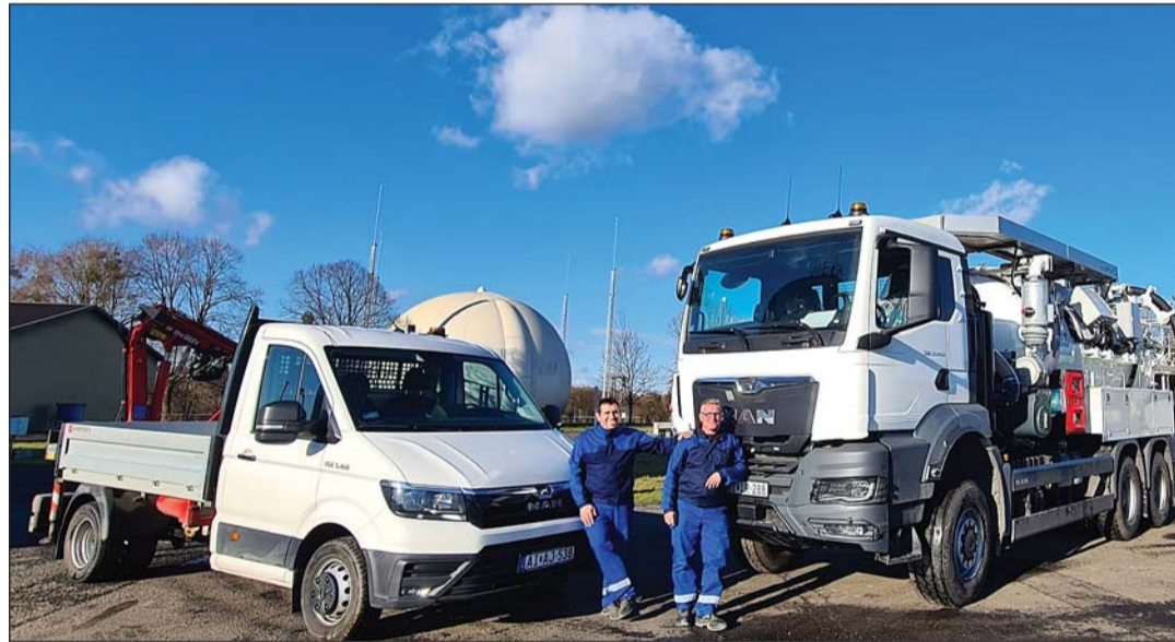
A ZMJV által átadott speciális járművek a szennyvízhálózat működtetéséhez.