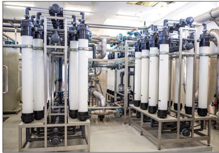
A zalaegerszegi nyugati víztisztító ultraszűrői.

fenntartható fejlődéshez. A tapasztalatok azonban azt mondják velem, hogy hiába van minden rendben, műszaki hibák mindig bekövetkeznek, s azokat orvosolni kell. Tavaly naponta átlagosan 34 hibánk volt. Ezek között előfordult csőtörés, műszaki és gépészeti meghibásodás egyaránt. A megoldás nem egyszerű, hiszen nem mindegy, hogy ki megy a hibát javítani, a javításokhoz különböző szakterületeknek kell ki-