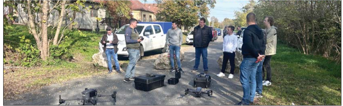
Dróntechnológia a víziközmű-üzemeltetésben.