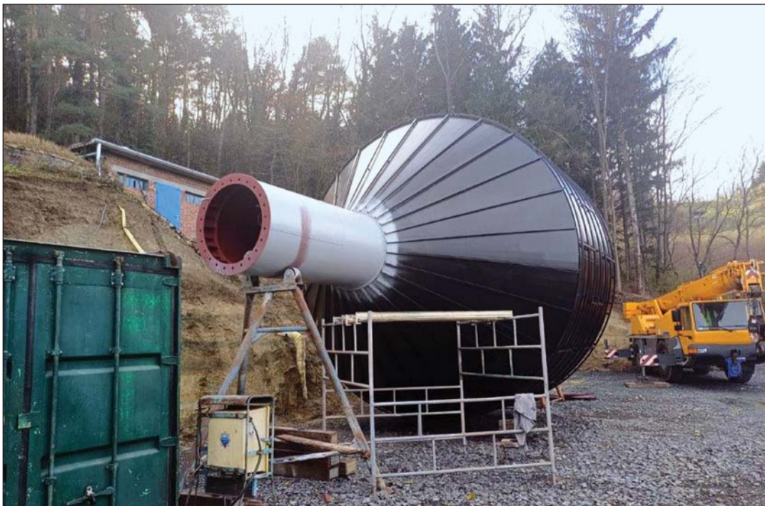
Az egervári ivóvízmű víztoronyépítése.