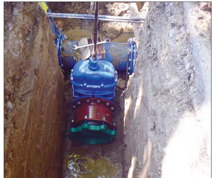
Ivóvízvezeték-szakaszolási lehetőség kialakítása.

alapján teljesen egyértelmű, hogy 2028–29-re – ha nem tesszünk semmit – elfelejthetjük azt a megszokott szolgáltatási színvonalat, melyet jelenleg nyújtunk. Ez azt jelentheti például, hogy hosszabb vízellátási szünetek lesznek, mert nem fogunk – a szakember- és működtetőeszköz-hiány miatt – azonnal minden hibához odaérni, nem tudjuk azokat egy időben kijavítani. Ezt szeretnénk elkerülni, s a cégünkhöz csábítani a legfiatalabb generációkat is. Ezt segítheti elő a négynapos munkarend, mely a tesztek alapján nagyon eredményesen működik. Ezzel kapcsolatosan szükség van még néhány változtatásra, egyeztetésre a minisztériummal, az érdekképviselettel, de úgy tervezzük, hogy hamarosan beindulhat a próbaüzem. Ha a fiatal szakem-