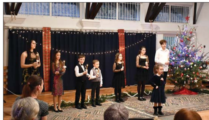
Karácsonyi műsor a helyi gyerekekkel.

– Szeretnénk, ha továbbra is minél többen részt vennének