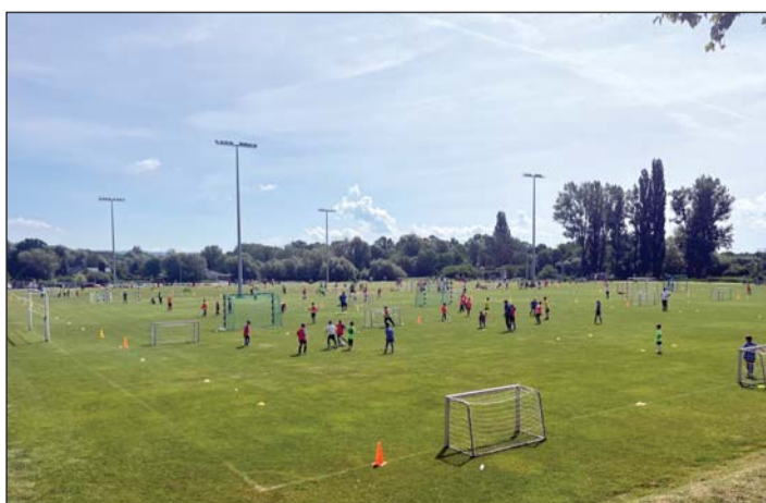
A sportcentrumban egyszerre 190 gyermek volt a pályán a Bozsik-program keretében.

– Ízek találkozása címmel rendezett nálunk vendéglátós napot a környékbeli konyhafőnökökből álló 13 Séf Egyesület. Térségbeli termelők, szakácsok és fogyasztók találkozási lehetőségeket a házgazdái, mintegy négyszáz vendég fordult meg a rendezvényen. Gazdag a sportélet, ahogy a kulturális területen is mindig történik valami. Már megszokott, hogy Alsópáhokon mindig kínálnak érdekes programokat a lakosok és az ide látogató vendégek számára – tette hozzá a polgármester.