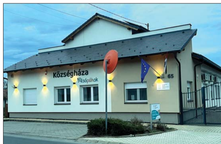
A felújított községháza.

Alsópáhokon a közösségi és civil élet is nagyon erős. Az önkormányzat kezdetől jelentős mértékben támogatja a tevékenységüket, ahogy az iskola és a három csoportos óvoda munkáját is mindenben segíti a falu vezetése.