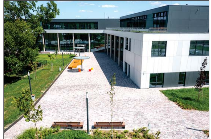
Szekszárd – tudásközpont.

Várban építjük újra a Budavári Királyi Palotát. Ezek mind volumenükben, mind pedig összetettségükben meghatározó projektek. Nem csak a mi éle-