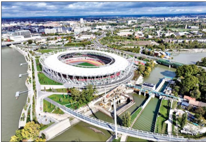
A Nemzeti Atlétikai Központ.

– A túlélésre való képesség! Ám a mi szakmánkat tekintve, nem jelenthet mást, mint a komoly szakmai tudást, a munka tiszteletét és a vállalat iránti lojalitást. Vannak, akik ezt akár