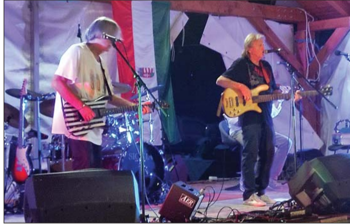
A Kormorán Memory Band.

matot a jövőben is folytatjuk. Közben várjuk az adatokat, a számokat, hiszen a költségvetés nagyban meghatározza a lehetőségeinket. Ismerve az anyagi helyzetünket, az előző testület felhatalmazott arra, hogy egy-két fontos fejlesztést beindítsunk, megvalósítsunk, részben saját forrást használva. Így a falu közepén a posta és az orvosi rendelő körül a parkolási gondokat kívánjuk megoldani. Készítettünk egy tervet, melyben körforgalommal egybekapcsolt parkolási rendszer létrehozása szerepel. Ha ez elkészül, jól orvosolja majd a problémákat, nagyban megkönnyíti az autósok helyzetét. Pályázatot nyújtottunk be a Magyar Falu Program kiírására, a járdaépí-