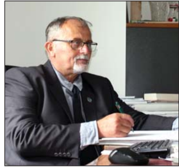
Vincze Tibor polgármester

Zalaapátiban az elmúlt két évtizedben összesen 2,5 milliárd forintot fordítottak beruházásokra, fejlesztésekre. Kétség nem férhet hozzá, hogy ez minden tekintetben látszik a településen.