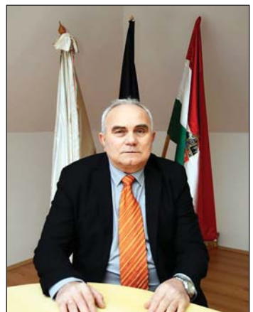
Horváth Zoltán polgármester

Tófeje polgármestere, Horváth Zoltán közel negyven esztendőn át nem csupán végig kísérte a település fejlődését, hanem sokat is tett annak felvirágoztatásáért.