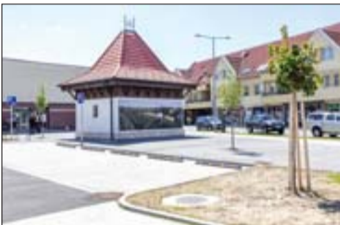
A Mérleg tér a Mérlegházzal

– Voltak országos, sőt nemzetközi érdeklődésre számot tartó beruházások a városban, és kisebb, de jelentős fejlesztések is. Sok más mellett megújult a búslakpusztai sportlőter,