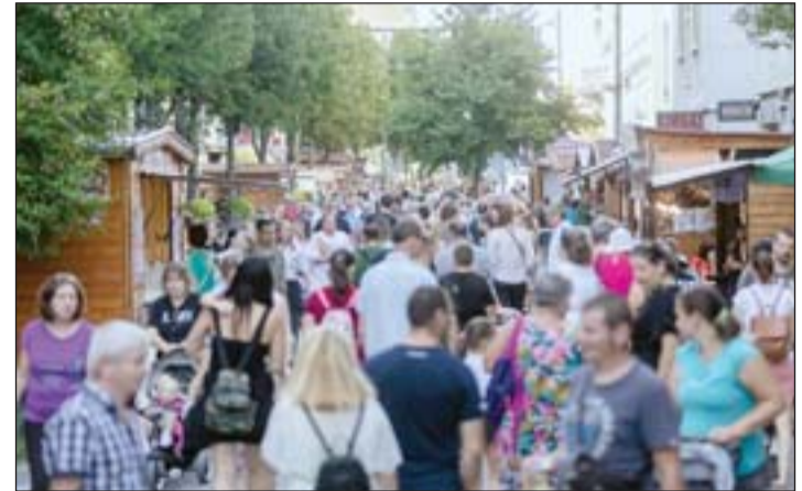
Az elmúlt években is népszerű volt a Vadpörkölt- és borfesztivál – zalai teríték.

gi legnagyobb beruházásaként zajlik a Kosztolányi utca felújításának, kétirányúsításának második üteme. A Kovács Károly Városépítő Program részeként további számtalan fejlesztés történik, ennek köszönhetően állami támogatással, közel 100 helyszínen újulnak meg vagy épülnek utak, járdák, terrek, parkolók.