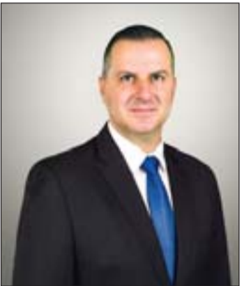
Balai cz Zoltán, Zalaegerszeg polgármestere

Idén az önkormányzati választásokkal lezárult egy öt éves ciklus, és elkezdődött egy új. Zalaegerszeg közössége egyértelmű döntést hozott, 73 százalékos többséggel választották újra szülővárosa polgármesterének Balai cz Zoltánt.