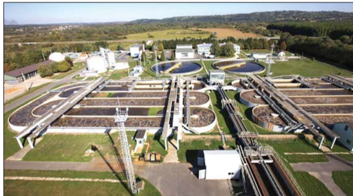
A zalaegerszegi szennyvíztisztító telep.

rünk, a tapasztalatokat feldolgozzuk, s úgy következhet a folytatás. A Zalavíz Zrt.-nél a napi munka mellett kiemelt kommunikációt fordítanak arra, hogy a fogyasztókat meggyőzzék a vízzel kapcsolatos spórolás fontosságáról. – Sokszor mondják, hogy „nektek az a jó, ha sokat fogyasztanak”. Ez nem igaz. A költségeket nem fizetik meg a fogyasztók, miközben kiemelten kell koncentrálnunk arra, hogy a jövő nemzedéke számára is legyen szolgáltatás, megfelelő mennyiségű ivóvíz. Én magam, s a Zalavíz Zrt. egyaránt azt kommunikáljuk, hogy senki ne öntözzön, ne mosson autót ivóvízzel. Az úszómedencét sem kell gyakran feltölte-