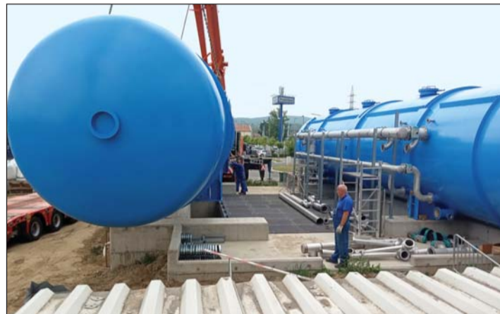
Zalaegerszeg keleti ivóvíztisztító – új szűrőtartályok beemelése.

ködtetés. Ha a költségeket nézzük, akkor ez nem egyszerű feladat, említsem csak a rezsi-csökkentés bevezetését, azt, hogy a fejlesztési, karbantartási költségeket a fogyasztók nem fizetik meg a díjban. Az idei évig a központi költségvetéstől nem kaptunk támogatást a hiányunk rendezésére, így karbantartáshány állapotba kerültünk. A vállalkozói díjakat egységesítették, a hiányt idén kiegészítik. Bízom benne, hogy ez a lakossági árnál is így lesz, s ismét a fenntartható működésben gondolkodhatunk. De először az a fő feladatunk, hogy utolérjük magunkat a karbantartásban, továbbá a működtetéshez szükséges eszközök terén is, hiszen jó állapotú, működésbiztos autók, spe-