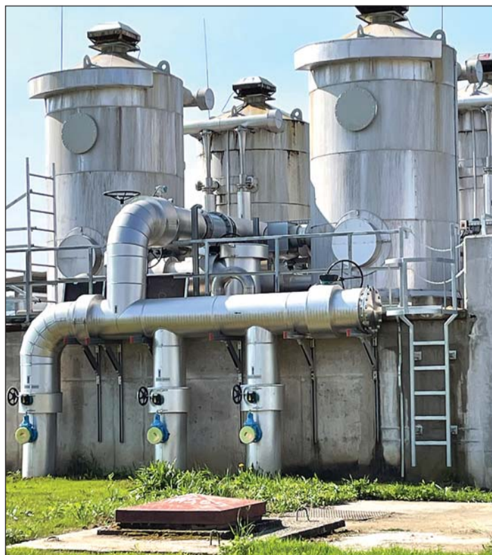
Zalaegerszeg Keleti ivóvíztisztító – metángáz-eltávolítás.

lyázatokot az ivóvíz- és szennyvízkezelési szolgáltatások fejlesztése érdekében. Az önkormányzataink (162 alkotja jelen-