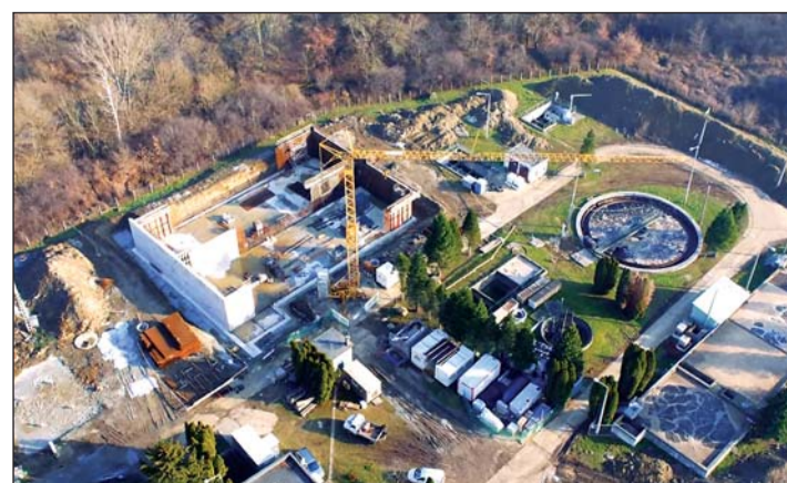
A lenti szennyvíztisztító telep fejlesztése.

– Hiszünk abban, hogy az elmúlt időszakban elvégzett és a közeljövőben tervezett ivóvíz- és szennyvízhálózat-rekonstrukciókkal és beruházásokkal unokáink közműhálózatát építjük meg, melyet megelégedettséggel használnak majd a jövőben. Fontosnak tartjuk, hogy a jelenben olyan értéket teremtsünk, amellyel hosszú távon magas minőségi színvonalon működő közösségi szolgáltatóként állhatunk felhasználóink és partnereink rendelkezésére – fogalmazott az elnök-vezérigazgató.